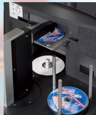
Vista del mecanismo robotico de la Omega

Soporta todos los formatos, incluyendo Doble Capa.